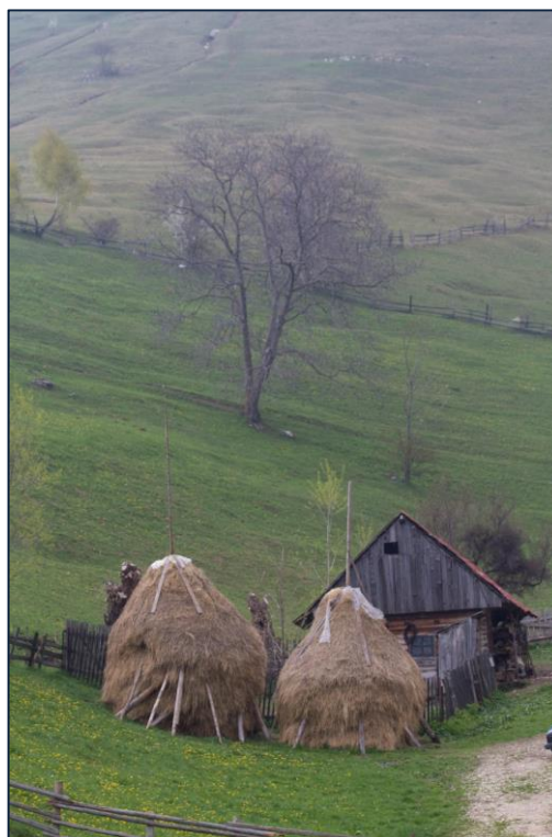
Figur 3: Høystakkar er framleis vanlege.