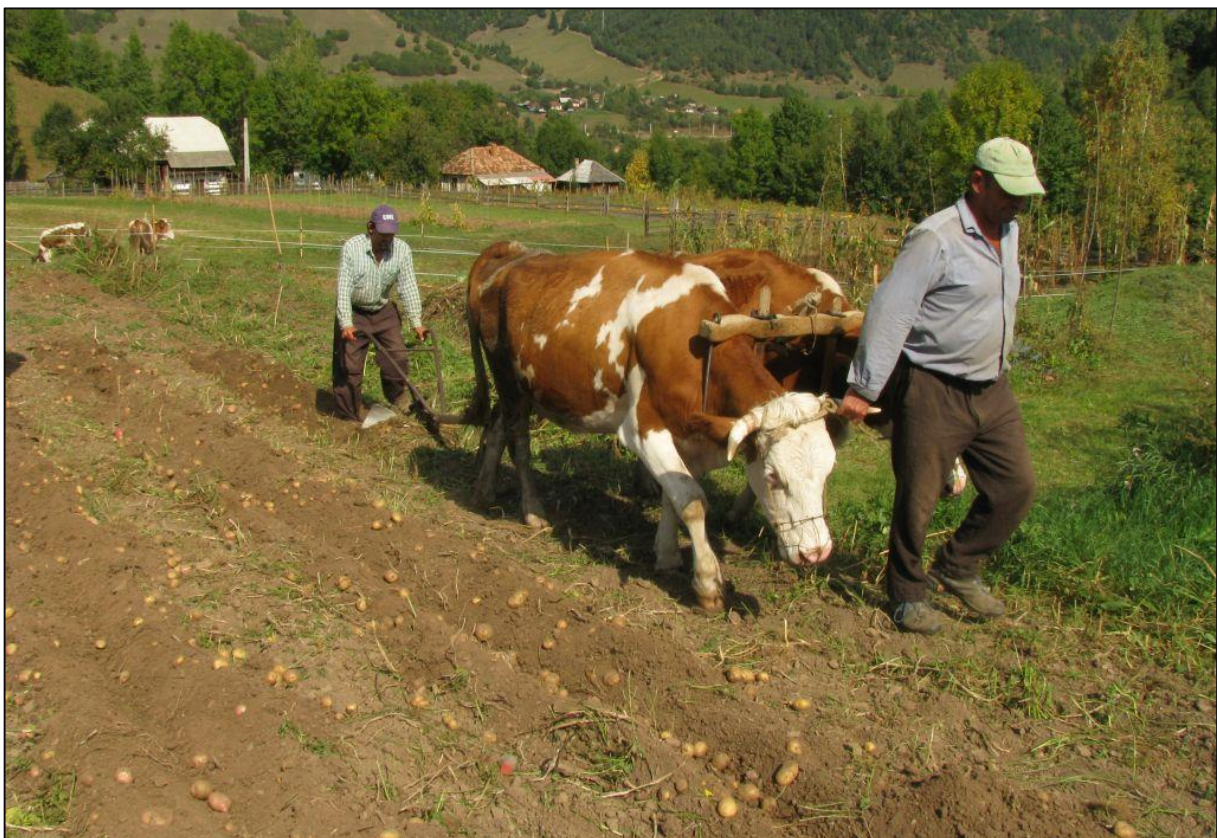
Figur 2: Potetoptak, Gyimes.

Vi bur 3 netter i sidedalen Aldomas på små pensjonat/ privat innkvartering.