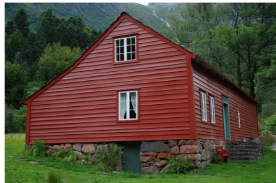
Foto 8. Husmannsplassen Treo frå 1840-åra er og ein del av Baroniet Rosendal.

Ved vårfloren var det ei orientering om bruken av utmarka og mjølking i vårfloren (foto 9).