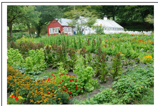
Foto 1. Kjøkken og urtehagen 25.08.08