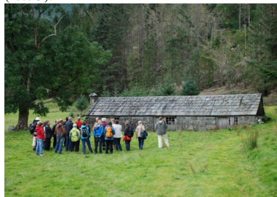
Foto 9. Vårfloren i Hattebergdalen.