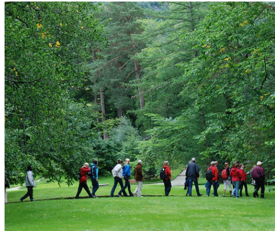
Foto 4 - 7. Glimt frå rosehagen og omvisinga i landskapsparken.